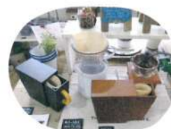
一番人気はカップの形をしたコースター

1981年福岡市にオープン。大川に移転してからも絶大な人気を誇る老舗インドカレー専門店。スパイスをたっぷり使ったカレーは、全部で12種類。どれも一度食べたらかせになる滋味深い味わいです。