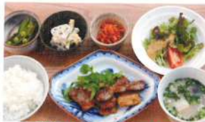
ごはん＆みそ汁がベースの 「ロッソランチ」750円。

家具屋が手がける、おしゃれなカフェ。地元の旬な野菜をふんだんに使ったメニューは、どれもヘルシーかつボリューム満点です。