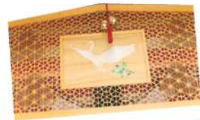
大川組子でできた大紙馬は、必見！