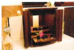
大川で作られたモダン仏壇。