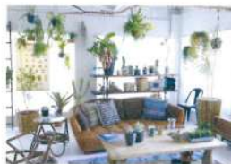
暮らしに彩を与えるグリーンもおすすめ！

多種多様なジャンルを組み合わせることで生まれるギャップやユーモアのある空間を提案する、関家具プロデュースのインテリアショップ。