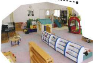
大川市は、保育料が福岡県で一歩 安いです。市内の子育て情報は、 ぜひこちらでチェックして。