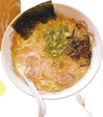
創業当時の変わらぬ味を守り続けている「らーめん」580円。