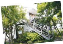
緑に囲まれたショールーム。 秋には、どんぐりがたくさん！