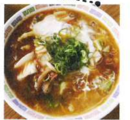
野菜やチャーシューがたっぷりだった「特製ラーメン」670円。