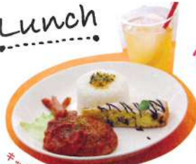
ホッヅプレート 550円