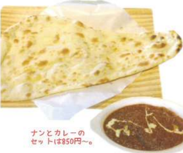
ナンとカレーのセットは$50円〜。