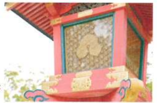
幻麗にも大川組子が使われています。

大川市民から「おふろうさん」と呼ばれ親しまれている風浪宮は、1800年前に創建された神功皇后ゆかりの神社。勝運の道を開いた少童命を祀ることから、受験や商売、そして恋愛にもご利益があるといわれており、市内外から多くの人々が訪れます。