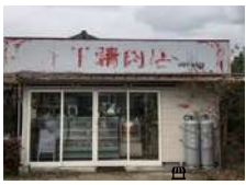
よるばい編集部 / 完山

木下精肉店 ☎0944-87-4875 大川市 酒見332-1 [営]11:00~ 20:00 (なくなり次第終了) [休]月曜&祝日