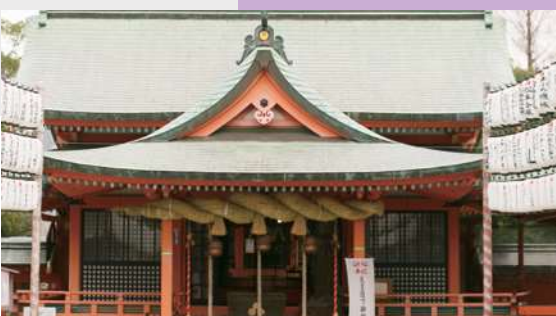
本殿は、国の重要文化財に指定されています。