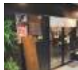
「中央マートの門をくぐって左奥にある」

中央マートに位置する串焼き専門店「かどで」は、女性同士でも気軽に訪れることのできるカジュアルな雰囲気の人気。最高級の炭で焼き上げる串焼きは