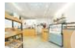
最新情報はInstagramをチェック!

COROICO コロイコ TEL: 090-2963-5615 大川市榎津 325-28 営: 11:00~18:00 休: 水曜日 日曜・祝日の営業時間 11:00~17:00 (ランチはサンドウィッチのみ営業) Instagram ▶ @coroico_adachicoffee